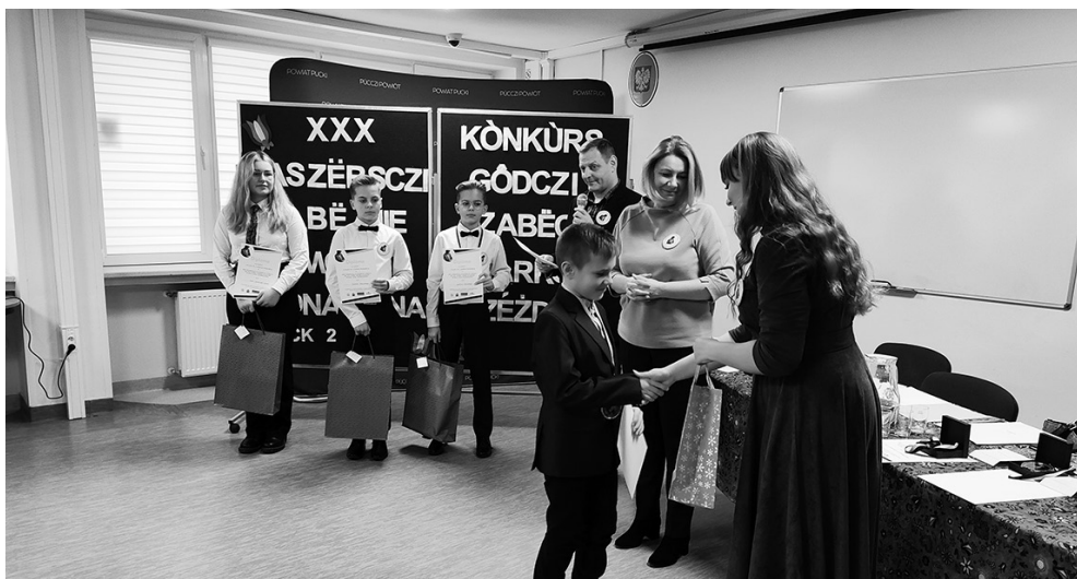
Òdj. K. Tèchòlskò

ny. Pò wòjnie jegò pòchòwelë w Tëlowie. W mòjich òczach stanãlë lzë i tak so pòmëslòl, jak to mùszalo bëc straszné. Dali bëlë grobë pòmòrdowónëch dzecy i baro wiòlgò kaplëca, dze są òdpròwióne msze za zmarlëch, chtërny mielë taką mǎczeniǎ smierc. Czedë jò wrócył dodóm, miòł jem tãli do òpòwiòdaniégò mòjim starszim, jaż czas bëł robic wieczersǎ.