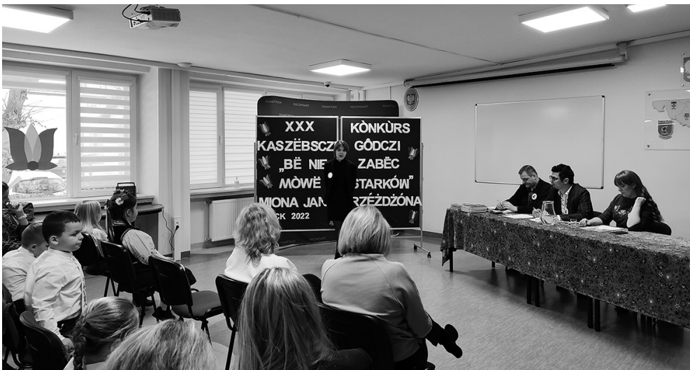
Ōdj. K. Tĕchŏlskŏ

Antŏni Bùbòlc, SP Starzĕno I mŏl w kategŏrie klas 1-3 SP Miesąc Darĕnkŏw