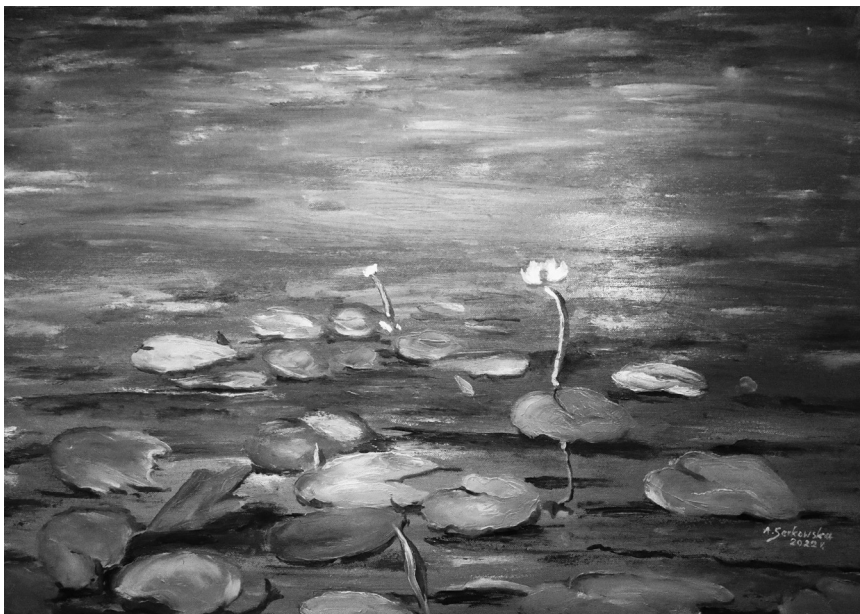
Òbrôz A. Serkòwsczi „Jezoro Bòrowò”

wspòminò dzečné lata i nôbarzi bòlesné doswiòdczenié w swòjim zëcym: