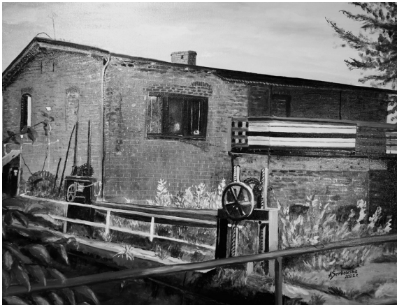
A. Serkòwskò, "Elektrowniò w Bòlszewie"

a złoti. Jakbë drãdżé zécé dało mù mòc, a nie słabòsc. A Dzeculkò na jegò rãkach zdòwało sã żewé jak strzébrowò, jakbë miało zarò ùcec, jak to doch dzecy mają w zwékù”.