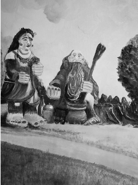
Òbròz A. Serkòwsczi "Stolemë"

To drëdzé wëbròt m.jin. Adóm Hébel w swòjim òpòwiëdaniom Sniący na dnie Bòrowa. Krëjamny òbròz jezora rozmieje òżëwac i zmieniac zëcë òbzërajacëch gò lëdzy. Tekst ten je przëmiarã smrocznégò fantasy: