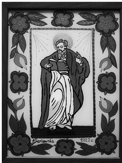
A. Serkòwskò, "Sw. Mateusz"

Jeden z òbrazów przedstòwiô apòstzoła Kaszëbów, sw. Òtona, chtëren w XII wiekù chrzcył najich przòdków na Zòpadnym Pòmòrziem. Eùgeniusz Prëczkòwsczi napisôł tekst, w jaczim sóm Òtón sã nie pòjòwiô, ale òpowiôdanié dzeje sã w môlu, dze nen swiãti je baro tczony. Tekst mô fòrmã legendë i je lëteracczim dolmaczenim, skądka wzãło sã wezwanié kòstkòwsczi parafie: „Ju za czile dni, w pierszych dniach