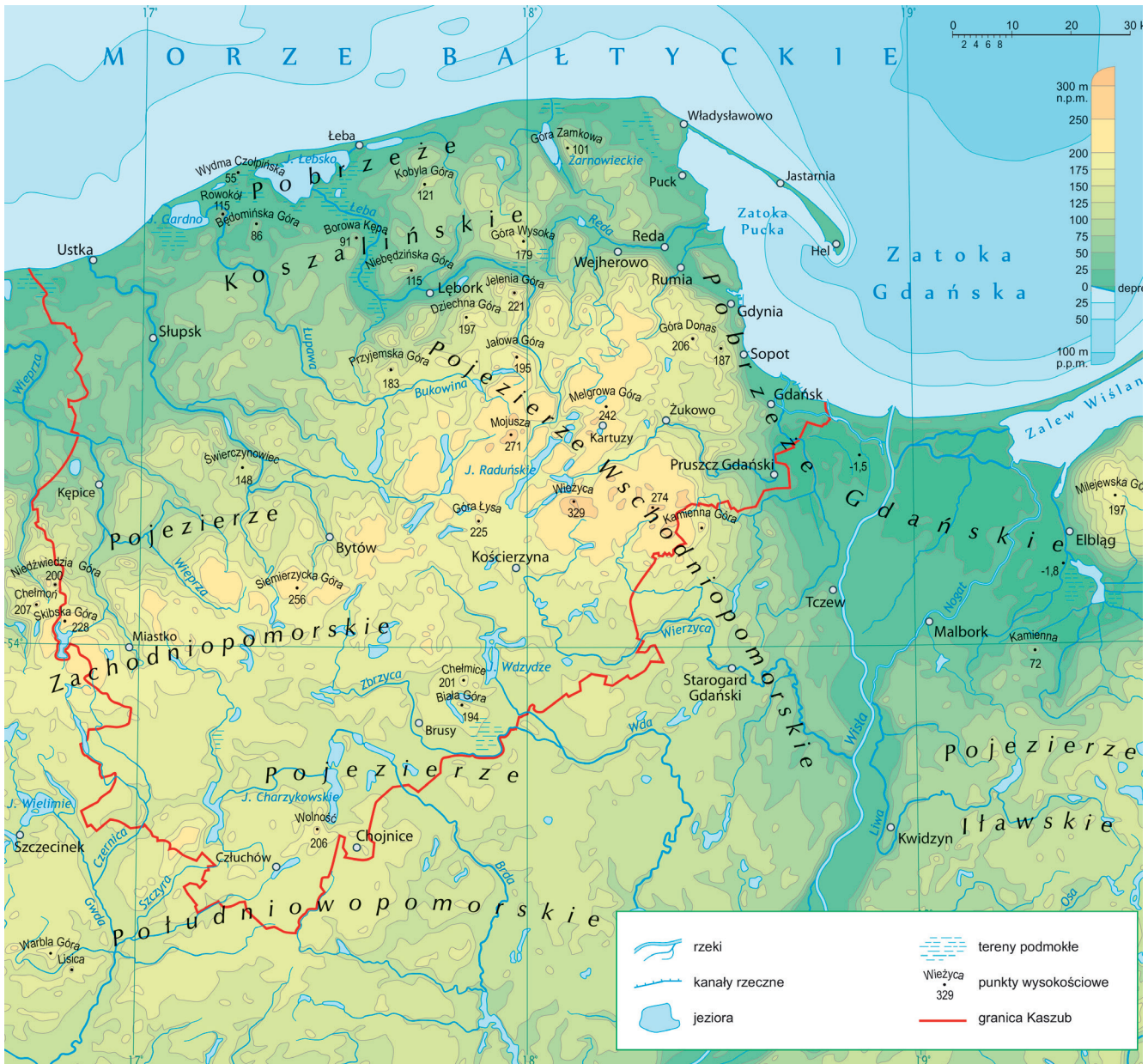
Źródło: Bióro Kaszěbskò-Pòmòrszczěgò Zrzeszeniò.

szkòlnò kaszěbszczěgò i pòlsczczěgò jãzěka w Spòdlecny Szkòłě w Mãcěkale i Wiòldzich Chelmach. Gòdò ò se, że mò szczescě, bò ji pròca je ji pasjã.